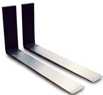
Garfo Polido com Chanfro Inteiro